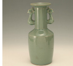
李奇休 (韓国物故作家) 青磁鳳凰耳花入 ¥110,000

国宝 砧青磁鳳凰耳花入「万声」 南宋時代竜泉窯 大阪・和泉市久保惣記念美術館蔵 この花入は、江戸時代初期には徳川家に蔵され、東福門院から京都山科の毘沙門堂に移されたという来歴と、形姿の豊かさ、釉質の潤沢さなどが賞玩しょうがんされ大切に扱われてきた。中箱の張紙は後西天皇筆と伝えられ、陽明文庫に伝わる同形式の「千声」とともに命名された。銘の由来となった白居易の詩「聞夜砧」に知られるように、「砧」とは本来槌つちで絹布を打つてのぼすための台を指すが、茶の湯の世界では最も美しいと評価された青磁の一群を指す語として用いられてきた。天正14年(1586)『山上宗二記』に、「礎之花入セイシ(青磁)なり」また『分類草人木』に、「砧天下一也。ひびき有りとして、砧と名付くる也」あり、砧を打つ様子が連想されていたこと、その後、ヒビの入ったものが砧を打つ「響き」にちなんで「砧」と呼ばれるようになった。