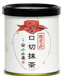
期間限定 口切抹茶 30g ¥1,780