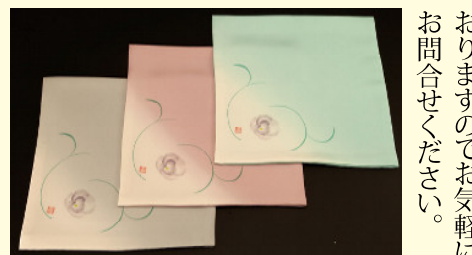
北村徳斎干支古帛紗「戌」各¥5,000 扇子「語」 男性用鼠色 ¥2,000 女性用 各¥1,800