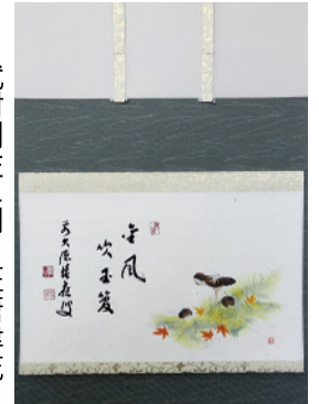
福本積應 松茸の図 “金風吹玉管” ¥36,000