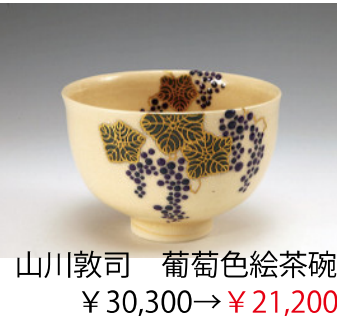
山川敦司 葡萄色絵茶碗 ¥30,300→¥21,200