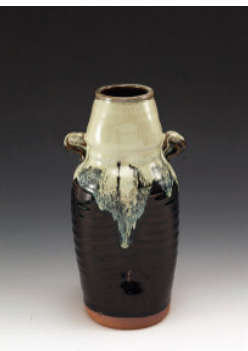
武村利左工門 朝鮮唐津花入 ¥25,800→¥18,000