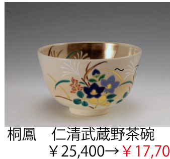
桐鳳 仁清武蔵野茶碗 ¥25,400→¥17,700