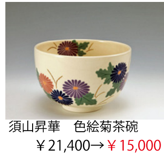
須山昇華 色絵菊茶碗 ¥21,400→¥15,000