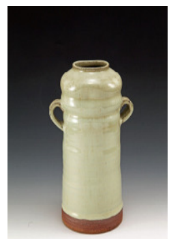
武村利左工門 斑唐津花入 ¥24,700→¥17,300